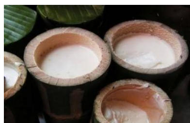
Gambar 2. Dadiah

Kualitas Dadiah cenderung berbeda karena proses pembuatan masih dilakukan secara tradisional hingga saat ini. Selain itu, fermentasi masih terjadi secara alami. Dibuat melalui fermentasi alami, Dadiah dibuat dengan memasukkan susu kerbau segar ke dalam tabung bambu dan ditutup dengan daun pisang yang sudah dilayukan. Setelah itu, susu disimpan pada suhu ruangan selama 24-48 jam. Setelah mengental, dadiah akan membentuk gumpalan yang stabil dan tidak akan pecah lagi pada suhu kamar sekitar 27°C.