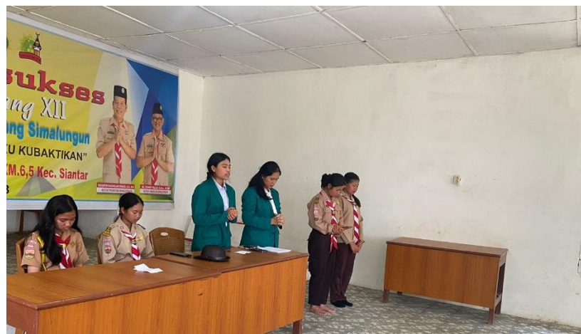
Gambar 1. Berdoa bersama

Sebelum kegiatan di mulai, para peserta di minta untuk berdoa agar kegiatan sosialisasi dan juga pelatihan game edukasi Pictionary nantinya dapat berjalan dengan lancar dan sesuai dengan harapan seluruh peserta. Berdoa di ikuti oleh seluruh tim pengabdian masyarakat dan seluruh anggota pramuka yang terlibat dalam kegiatan ini. Kegiatan berdoa di pimpin oleh salah satu tim pengabdian masyarakat, yaitu seorang mahasiswa STIKOM Tunas Bangsa Pematangsiantar.