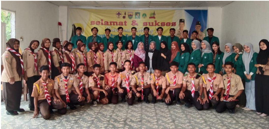
Gambar 5. Peserta Game Edukasi Pictionary 1