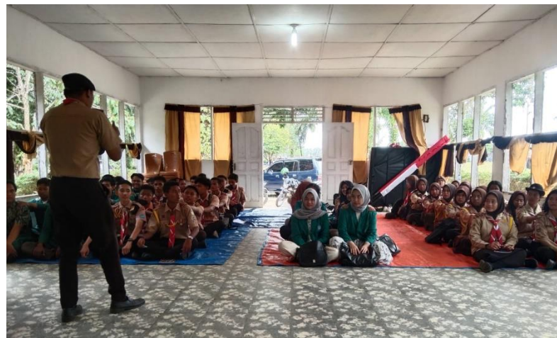
Gambar 2. Pemberian Kata Sambutan oleh Pembina Pramuka

Sebelum masuk kegiatan, ada beberapa kata sambutan yang disampaikan oleh kakak Pembina pramuka. Isi sambutan berupa motivasi untuk seluruh peserta pramuka yang mengikuti kegiatan ini dari awal sampai akhir. Para peserta juga sangat antusias mendengarkan kata sambutan yang diberikan oleh Pembina Pramuka.