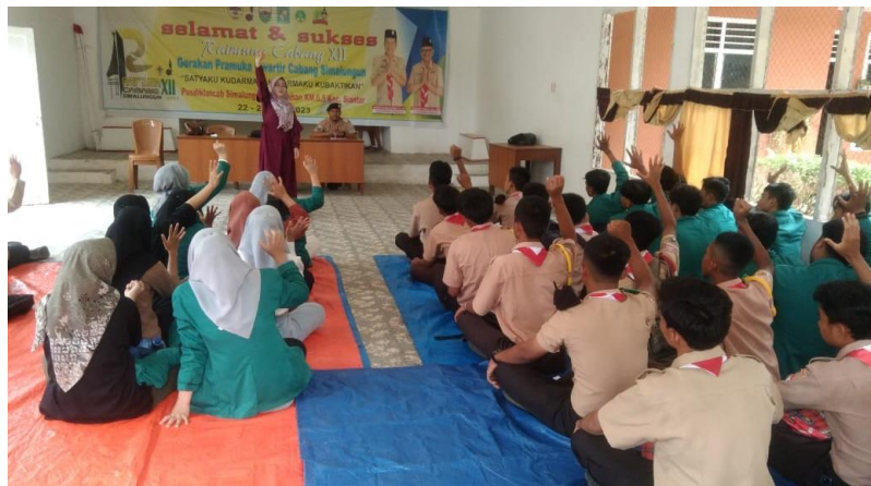
Gambar 4. Siswa sangat antusias mengikuti Game Edukasi Pictionary

Pictionary adalah permainan tebak kata berdasarkan gambar yang di mainkan secara berkelompok. Masing – masing kelompok mendapatkan kartu yang berisi beberapa kata. Kemudian mereka memilih satu kosakata, yang selanjutnya bagi pemain lain adalah menebak kata berdasarkan gambar yang dibuat. Dalam kegiatan ini, kelompok yang menjadi pemenang adalah yang berhasil menebak banyak kata secara benar. Hal ini sangat menantang para peserta untuk mengenal dan memahami kosakata lebih banyak, sehingga mereka akan gampang membuat suatu kalimat melalui sebuah kata. Dalam kegiatan ini peserta sangat antusias sekali mengikutinya. Seluruh peserta aktif menjawab beberapa rangkaian kegiatan yang telah dibuat.