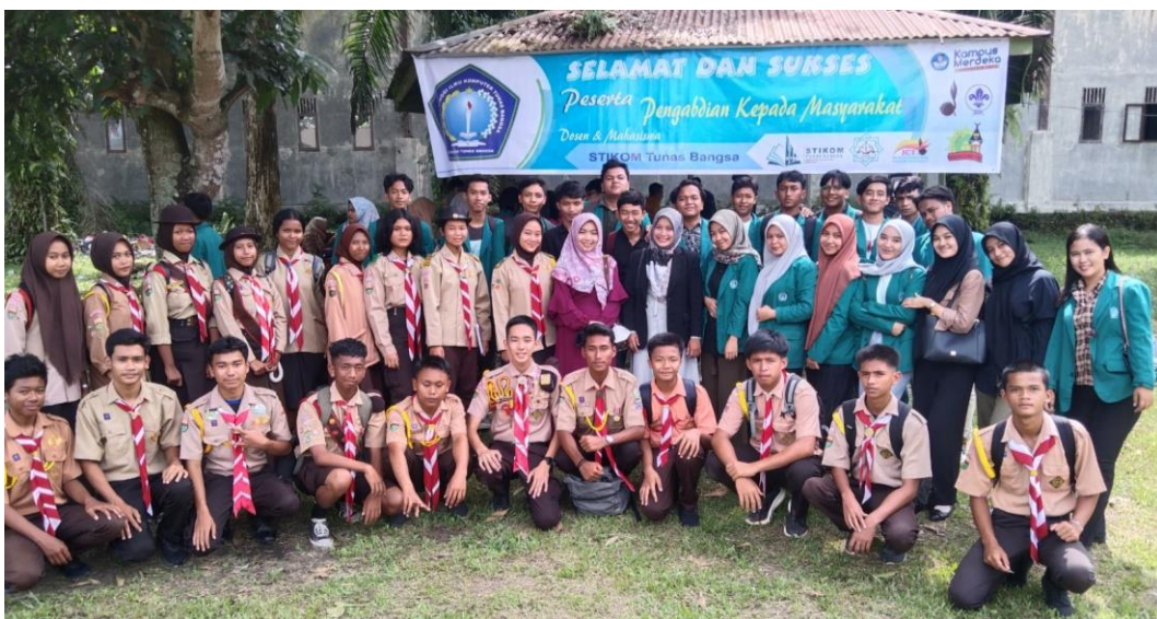
Gambar 6. Peserta Game Edukasi Pictionary 2

Kegiatan ini memberikan dampak positif bagi semua kalangan. Pelatihan ini akan memberikan pengetahuan baru kepada para anggota pramuka dalam mengetahui dan memahami Game Edukasi Pictionary. Hal ini juga menambah semangat siswa dalam belajar Bahasa Inggris di luar Pendidikan Formal. Pengabdian ini diawali dengan pengenalan kepada seluruh anggota Pramuka. Kegiatan PKM ini sangat membantu para peserta / anggota pramuka untuk lebih aktif mengikuti kegiatan yang membuat mereka