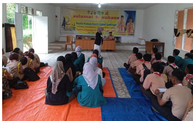
Gambar 3. Sosialisasi Perkenalan Game Edukasi Pictionary

Sosialisasi melalui presentasi menggunakan demonstrasi dan sharing untuk mengenalkan betapa pentingnya memahami Bahasa Inggris. Adapun dalam sosialisasi ini, tim pengabdian masyarakat juga menjelaskan kepada para peserta tentang game edukasi bernama Pictionary. Pictionary merupakan salah satu game yang dibentuk melalui sebuah kelompok. Hal ini berguna untuk meningkatkan minat dan semangat para peserta dalam belajar Bahasa Inggris.