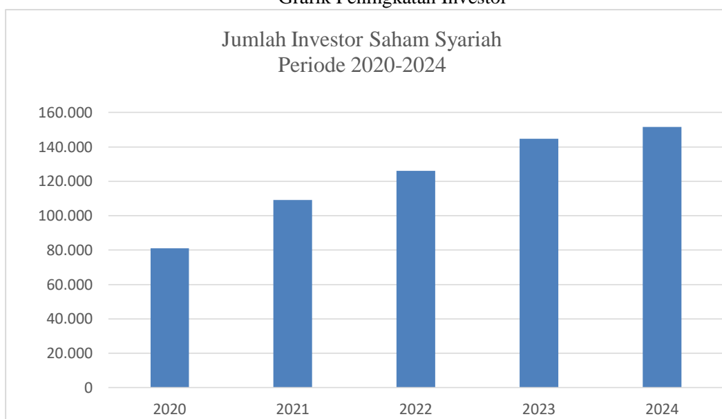
Gambar 1 Grafik Peningkatan Investor

Sumber data: www.ojk.go.id (Data diolah, 2024)