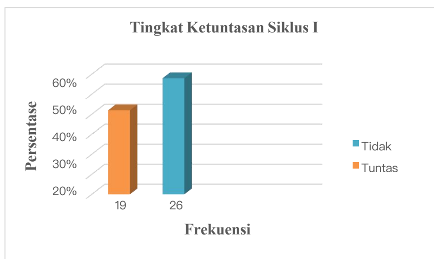
Grafik 1 Tingkat Ketuntasan Siklus I

Dari grafik 1 dapat dilihat bahwa terdapat 58% peserta yang tidak tuntas dalam siklus I atau sebanyak 26 orang dan untuk yang mencapai nilai ketuntasan yaitu 85 sebanyak 19 orang atau 42%.