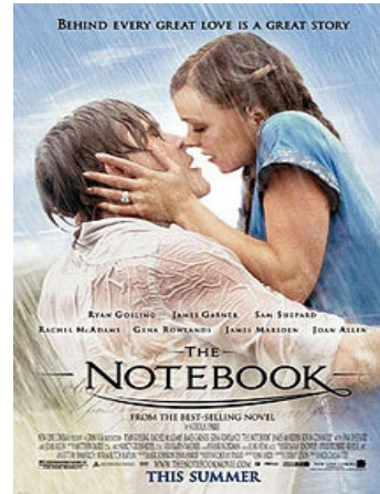
Gambar 1: Poster Film The Notebook

Noah Calhoun muda, Rachel McAdams sebagai Allison Hamilton muda/ Allie , James Garner sebagai Noah Calhoun tua/ Duke , dan Gena Rowlands sebagai Allie Calhoun tua (Wikipedia, 2015).