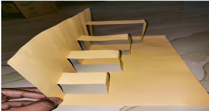
Gambar 2.3: Menggunakan kertas oranye untuk membuat buku pop-up