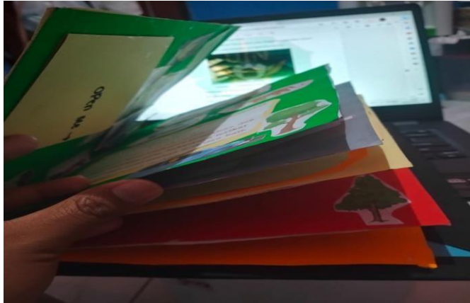
Gambar 2.2 : Pembuatan halaman pop-up book

1. Menggunakan kertas asturo tebal (duplex) dan double tape, buat halaman buku pop-up.