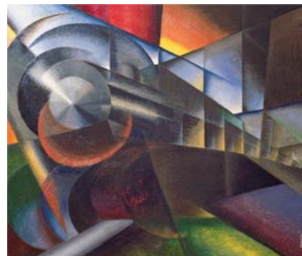
Gambar 1 Ivo Pannaggi – “ Speeding Train ”

Kecepatan adalah tuhan yang baru. Oleh karena itu, simbol-simbol kecepatan, seperti mobil, jauh lebih indah daripada Winged Victory of Samothrace . 15 Oleh karena itulah seniman-seniman dalam gerakan futurisme sering menggunakan mobil, motor atau kereta api sebagai objek estetis, seperti yang terlihat dalam lukisan “ Speeding Train ” karya Ivo Pannaggi dan “ Speed of Motorcycle ” karya Giacomo Balla: