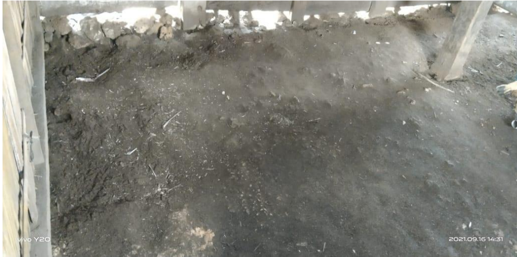
Gambar 3. Struktur lantai rumah masyarakat Desa Nuwewang