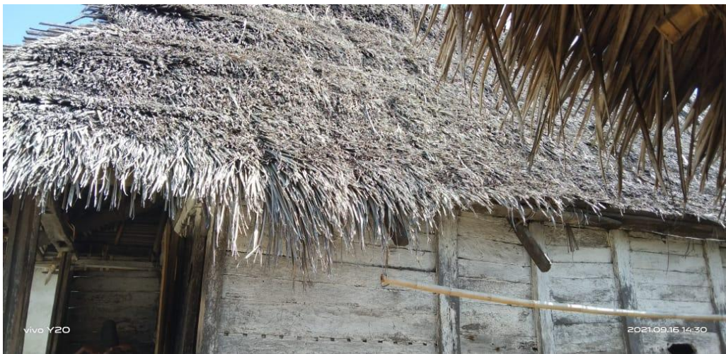
Gambar 4. Atap rumah masyarakat Desa Nuwewang

Bangunan sebagai bentuk kearifan lokal terhadap bencana pada masyarakat Desa Nuwewang juga dapat dilihat pada bangunan tradisional lainnya di Maluku. Berdasarkan hasil observasi dapat diketahui bahwa struktur bangunan di Desa Nuwewang dibuat sesuai dengan kondisi lingkungan yang rawan bencana gempa, yang dapat dilihat dari pondasi bangunan berupa batu umpak yang ternyata sangat cocok untuk bangunan yang memiliki rangka bangunan kokoh dan sambungan kaku antara komponen struktur bangunan menggunakan sistem pen dan pasak, dan bahan struktur utama menggunakan kayu dan bambu yang elastis dan tanah liat serta atap rumah masih terbuat dari daun kelapa kering ( nurtawi ).