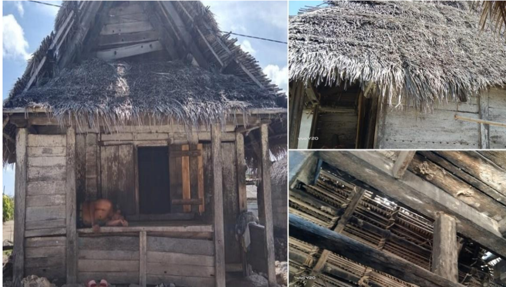
Gambar 2. Rumah Adat Masyarakat Desa Nuwewang

Wujud kearifan lokal inilah yang selanjutnya menjadi basis bagi masyarakat Desa Nuwewang dalam menghadapi bencana gempa. Bentuk mitigasi bencana berbasis kearifan lokal tersebut berbentuk pada bangunan tradisional yang terbuat dari bahan alam, yakni rumah adat. Rumah adat sebagai salah satu bentuk mitigasi bencana dapat dilihat melalui konstruksi atau bangunan, teknik sambung dan ikat, serta bahan yang digunakan untuk menutup bangunan tersebut. Konstruksi bangunan rumah menggunakan bahan yang berasal dari lingkungan sendiri seperti kayu dan bambu. Struktur bangunan didirikan pada sistem rangka yang terbuat dari kayu berupa balok dan tiang persegi panjang. Struktur penutup dinding terbuat dari papan kayu kole yang dibiarkan warna dan karakter aslinya. Bambu yang dibelah juga digunakan sebagai struktur penutup pada ujung anyaman bambu. Semua detail konstruksi diselesaikan dengan prinsip ikatan, alas, pasak, alas menempel, dan sambungan terkait. Orang tua pribumi melarang penggunaan paku dalam pembuatan rumah. Untuk pengikat umumnya digunakan rotan dan bambu, atau dengan teknik pasak. Struktur lantai rumah umumnya masih terbuat dari tanah (gambar 3). Sedangkan untuk struktur utama atap rumah digunakan atap dari daun kelapa ( nurtawi ) dengan bambu dan tali yang dibuat dengan pohon kole sebagai pengikat. Jika terjadi gempa, maka struktur rumah akan bergerak dinamis sehingga terhindar dari kerusakan atau kehancuran (gambar 4).